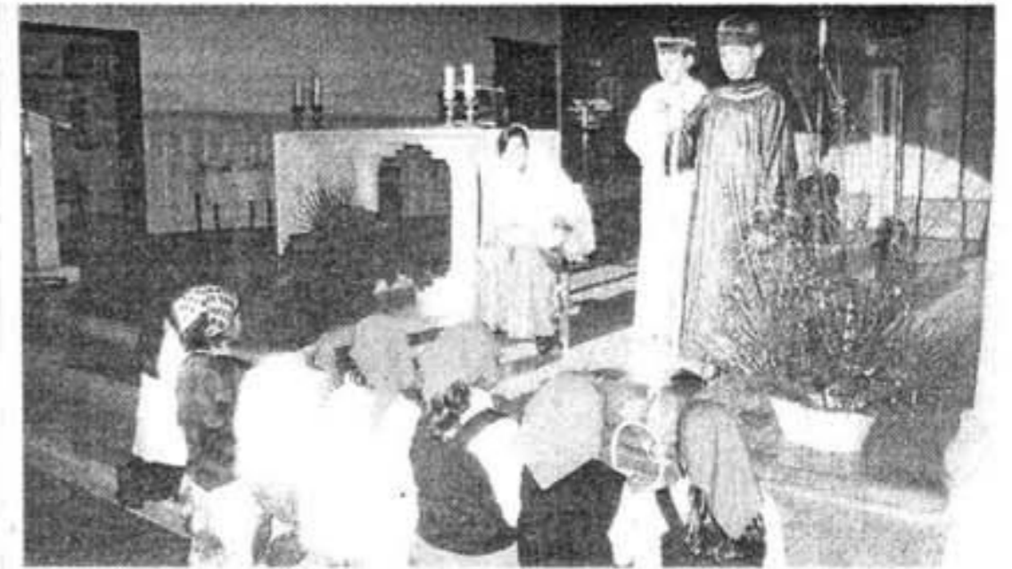
VIVIENTE. Un grupo de niños puso en escena varios pasajes