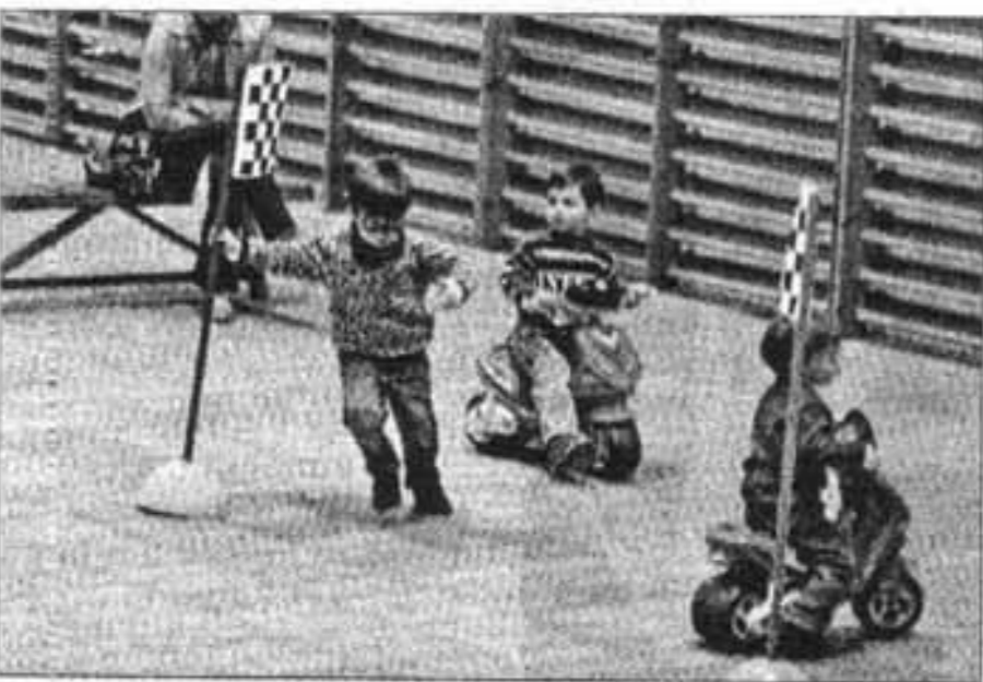
Los más pequeños fueron los que más disfrutaron de la pista

★ MAÓ MURÓ ANDRATX GETAFE SANT LLUÍS POLLENÇA CALVIÀ FERRERIES LAS PALMAS PETRA LLUCMAJOR BUNYOLA BARCELONA SANT JOAN DE LABRITJA SANTA EULÀRIA RAFELBUNYOL INCA MOSTOLES BÚGER L'HOSPITALET DE LLOBREGAT VILAFRANCA DE BONANY SANTA MARGALIDA ARTÀ VALLEMOSSA SINEU SANTA MARIA DEL CAMÍ VILLANUEVA DE LA CANADA LAS ROZAS SA POBLA ES CASTELL MARIA DE LA SALUT ALCÚDIA ES MERCADAL LLOSETA MANCOR DE LA VALL CONSELL MARRATXI COLLADO VILLALBA BINISSALEM SELVA SANT JOAN MANACOR VALENCIA PORRERES LLUBÍ ALAIOR ESPORLES PALMA FELANITX CASTELLO DE LA PLANA COSTITX ALGAIDA SANTA EUGENIA CIUTADELLA PUIGPUNYENT ES MIGJORN GRAN SES SALINES MONTUIRI SANTANYI ALBACETE MADRID SANT ANTONI DE PORTMANY SANT LLORENC DES CARDASSAR PINTO SENCELLES FORMENTERA CAMPANET SÓLLER GANDIA SANT JOSEP DE SA TALAIA ALARÓ EIVISSA CAMPOS ALCALÁ DE HENARES ALACANT DEIÀ SON SERVERA CAPDEPERA ALCORNENDAS