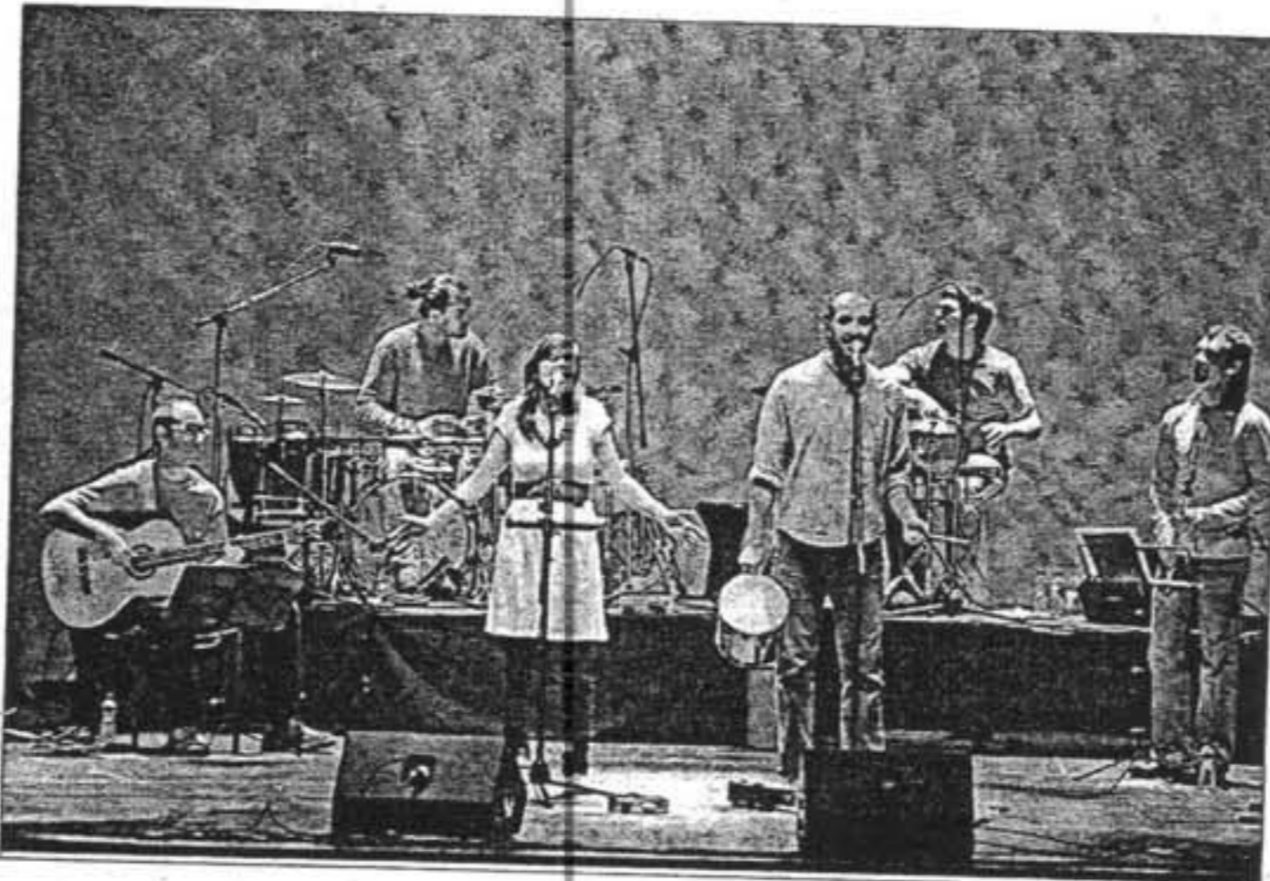
Imagen de S'Albaida en el Teatre Principal de Maó, cuando presentó su último disco 'Xalandria'.

rán una gira que les llevará el 27 de agosto a Maó, el 29 a Sant Antoni de Portmany en Eivissa, el día 30 al Teatre Principal de Palma y el 5 de septiembre al Festival de Música de Matadepera.