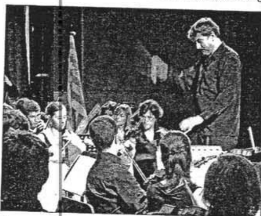
Imagen de una actuación de la OJIPC en 2007.

Este año son cinco los jóvenes músicos menorquines que se integran en el grupo dirigido por Brotons